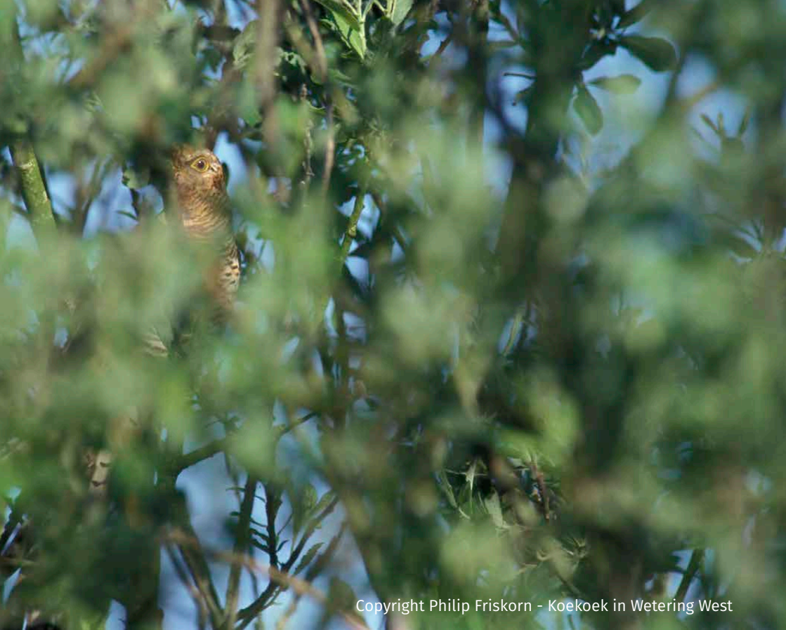
Koekoek in Wetering West