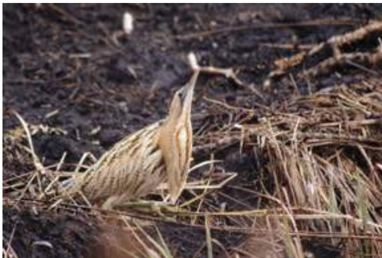
1e prijs Jantje Steenbergen

concurrentie toe want het aantal leden van de vogelgroep is behoorlijk gestegen en bedraagt nu al 25. Veel succes allemaal!